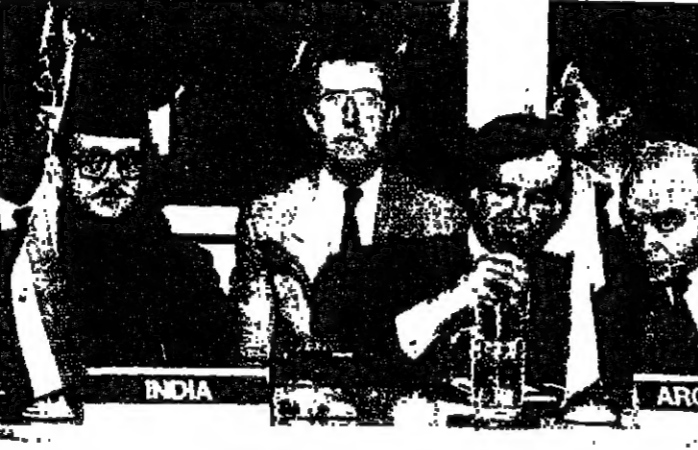
رئيس وزراء الهند ورئيس الارجنتين خلال المؤتمر